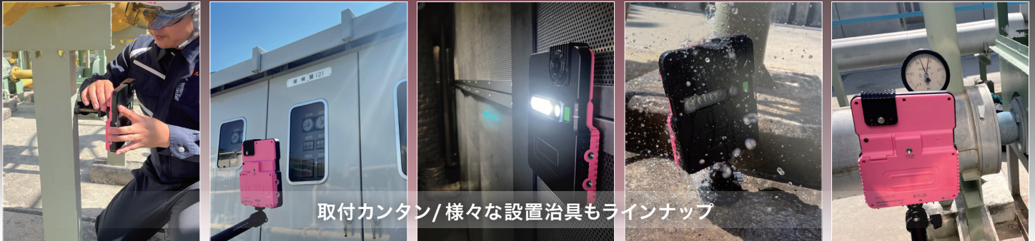
取付カンタン/様々な設置治具もラインナップ

既存計器を活用するので環境にも優しい。トライアルも可能ですので、お問い合わせください。